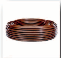
Tropfschlauch - Unitechline, Tropfabstand 30 cm, Rollenlänge 100 m, 16 mm-