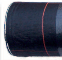
Maypexfolie - Bändchengewebe Rolle 200 cm breit, 100 gr/qm, schwarz, 100 lfd