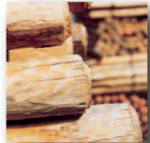
Baumpfahl kesseldr. imprägniert 2,5 m 5/7