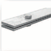
Rhizomsperre Wurzelsperre Verschluss-Set 70 cm