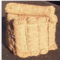
Kokosstrick Dhol 70 m/kg - 2 kg