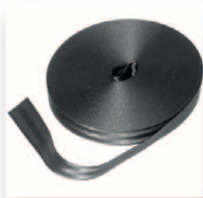
PES Baumgurt - Rollenlänge ca. 50 m, Breite 4,8 cm