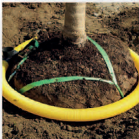
Drainage Bewässerungsset komplett 8 m- DN 80 mit T-Stück u. Walu-Endkappe